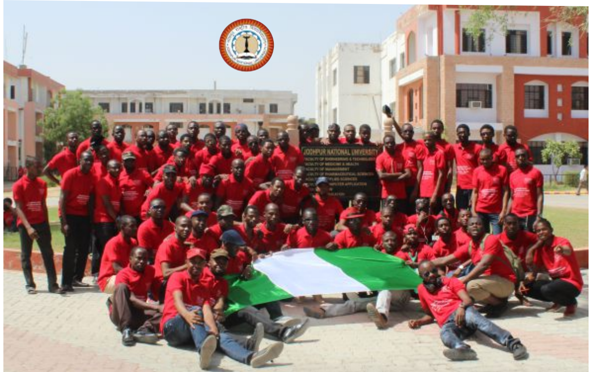
Nigerian students at Jodhpur National University Celebrating as Mr. Muhammad Buhari